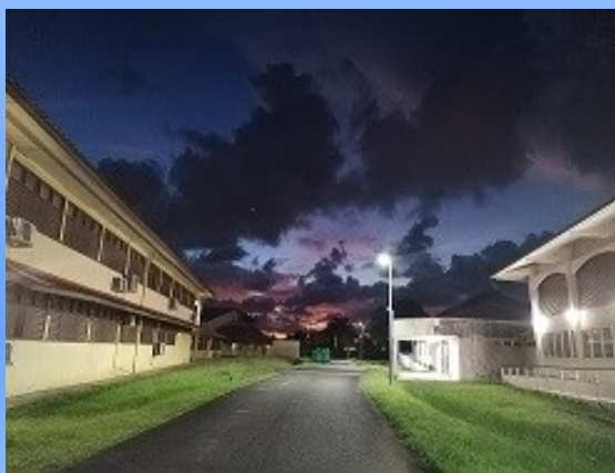
Lycée Félix Éboué